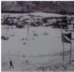
Schülerwettbewerbe 4.2. und 5.2.1967