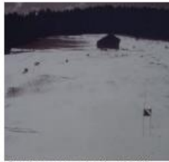
Tiroler Schülerwettbewerbe 4.2. und 5.2.1967