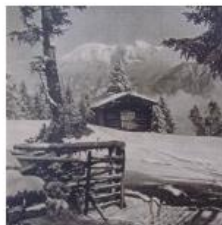
Nazn Stadele (Stieglreith)