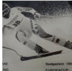
Badgastein 1991 EUROPCUP