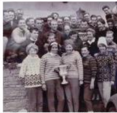
Schauaufzug Lemmoos - Anfang der 60iger Jahre