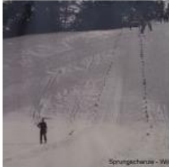
Sprungschanze - 1968